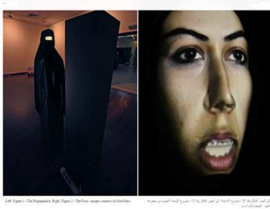
Left: Figure 1 – The Zippouk. Right: Figure 2 – The Face